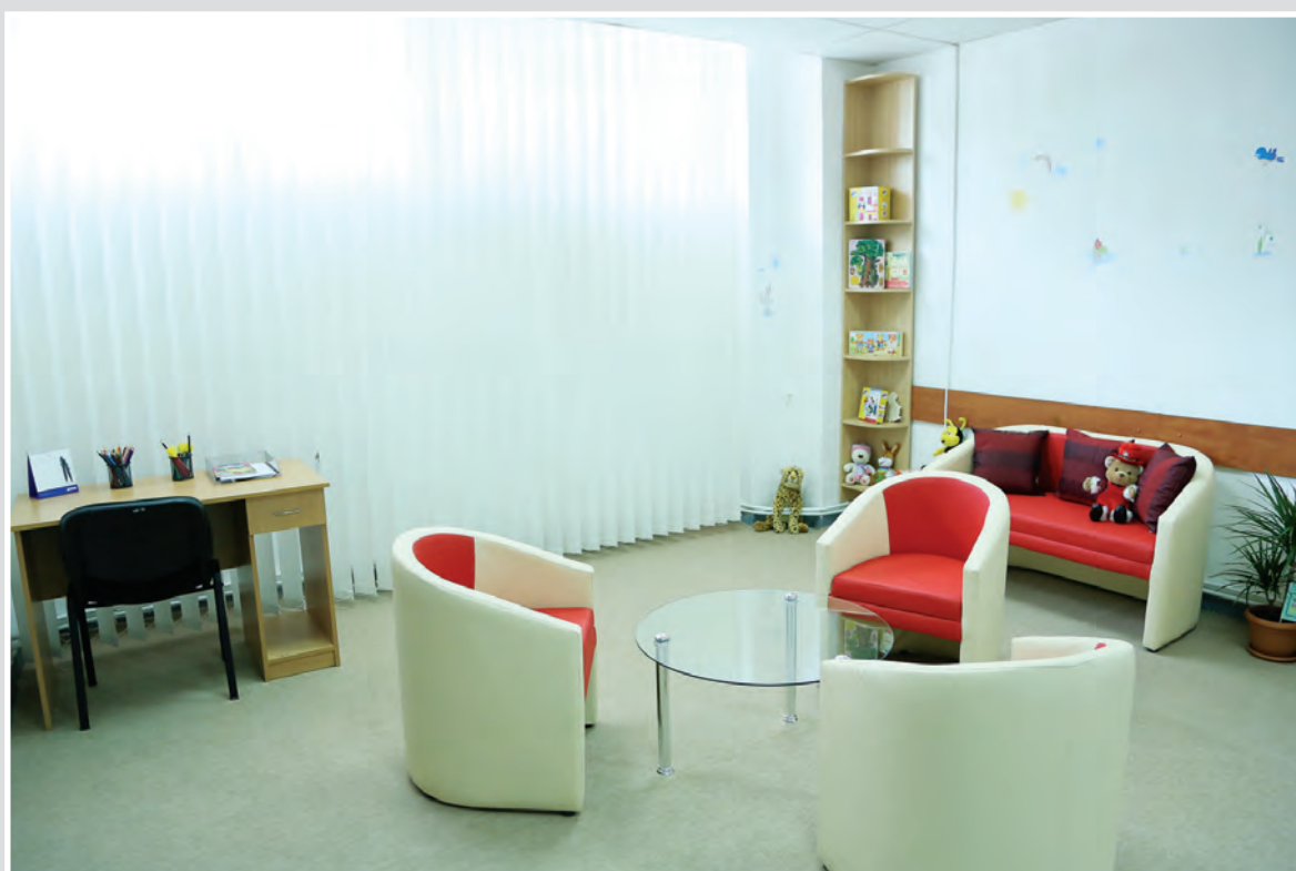
Стая за изслушване на деца в Клуж-Напока, Департамент Клуж, Румъния