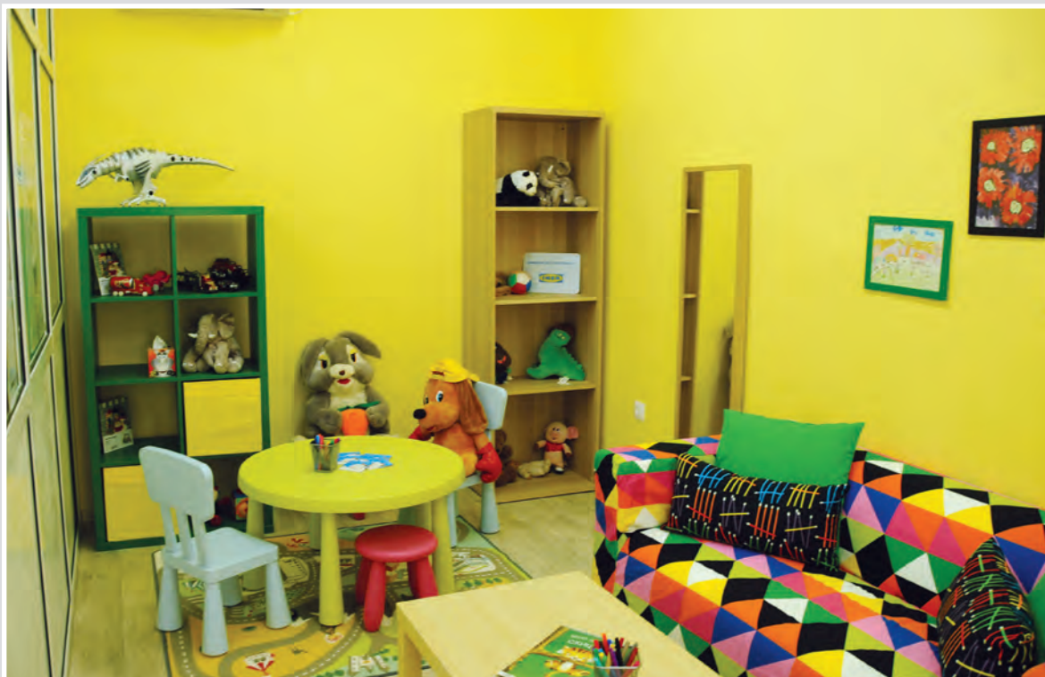
Зона ЗаКрила, Шумен – Залата за подготовка: детето се запознава с предстоящата процедура, след което разглежда „синята стая“ в двете ѝ части.