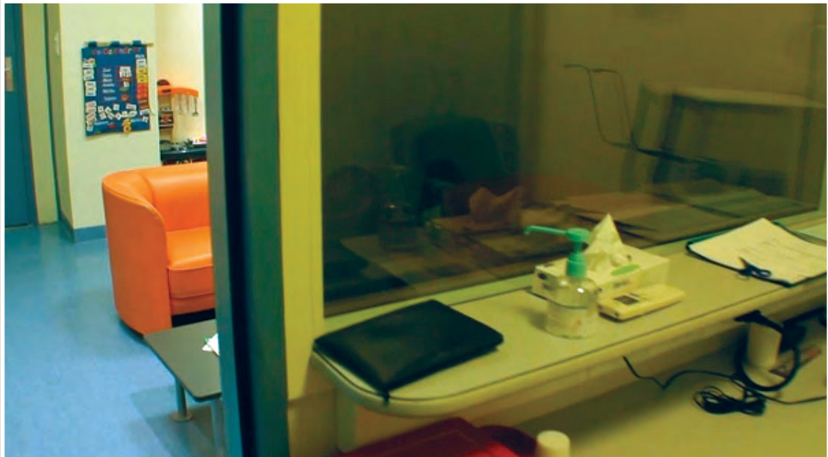
Помещението, в което се намира техниката за аудио и видео запис, е отделено с венецианско огледало от помещението, в което се провежда разпита. ПМПЗ в Анже, Франция