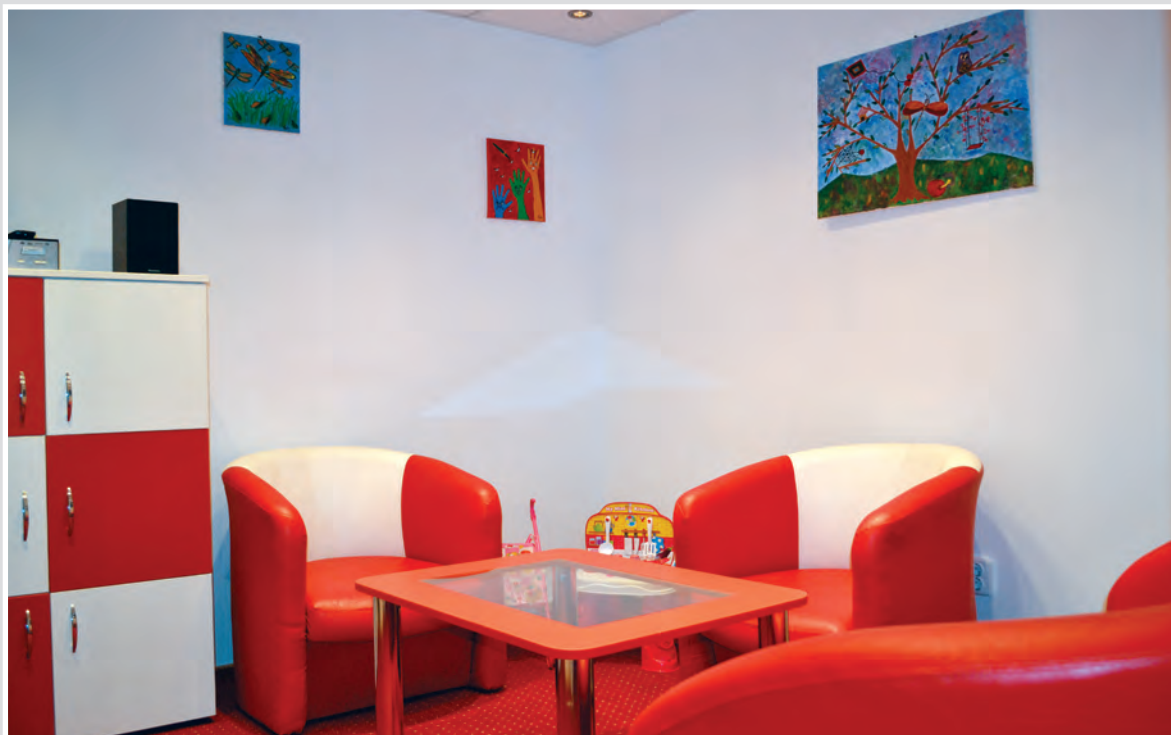
Стая за изслушване на деца в Крайова, Департамент Долж, Румъния