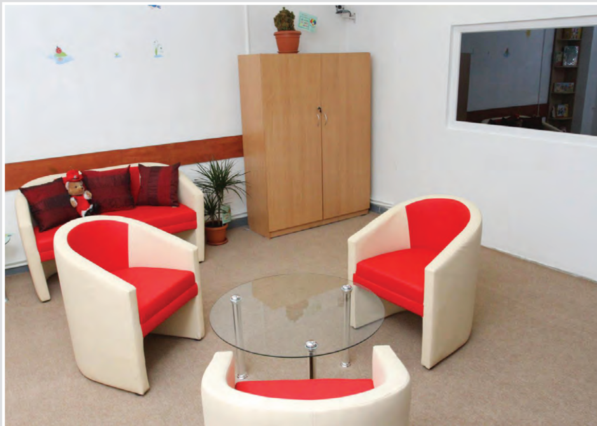
Стая за изслушване на деца в Клуж-Напока, Департамент Клуж, Румъния