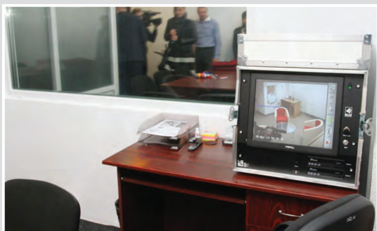
Техническото помещение в стаята за изслушване на деца в Клуж-Напока, департамент Клуж