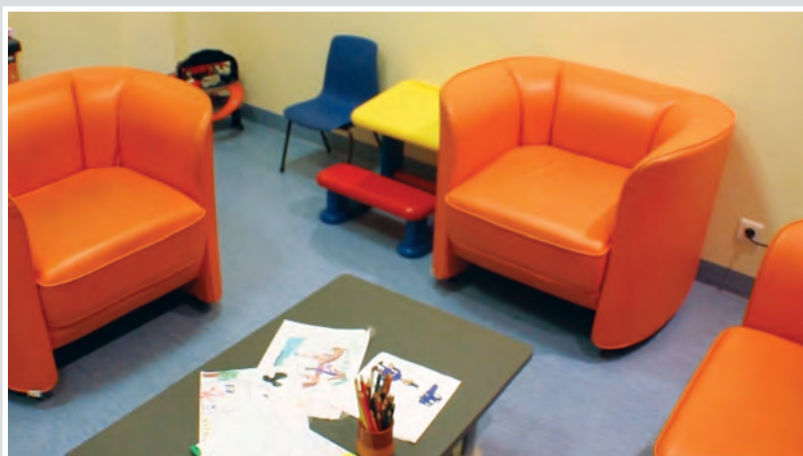
Стая за защитено изслушване в Педиатричното медико-правно звено в Анже, Франция