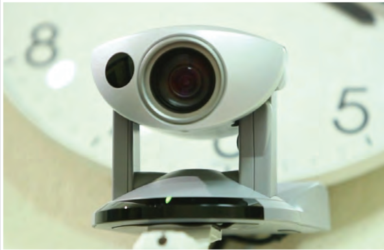
Камерата, с която се извършва видео запис в стаята за изслушване в Анже, Франция