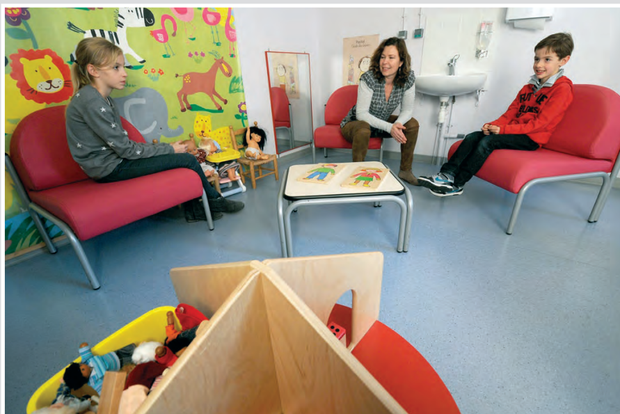
Стая за защитено изслушване в ПМПЗ в Орлеан, Франция