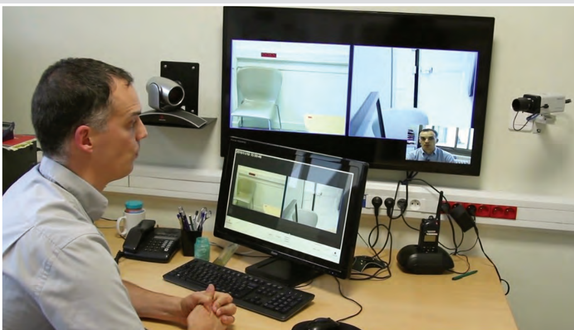
Първа стая за непряка очна ставка в Полицията в Анже, Франция