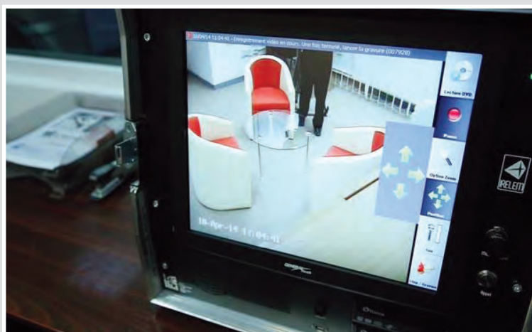
Техника за осигуряване на аудио и видео запис в стаята за изслушване на деца в Клуж и Долж, Румъния