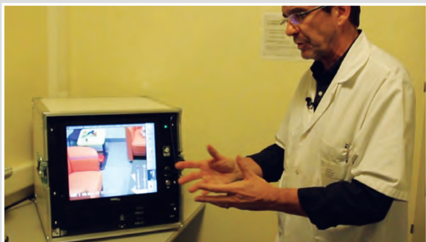
Техническото помещение в ПМПЗ в Анже, Франция